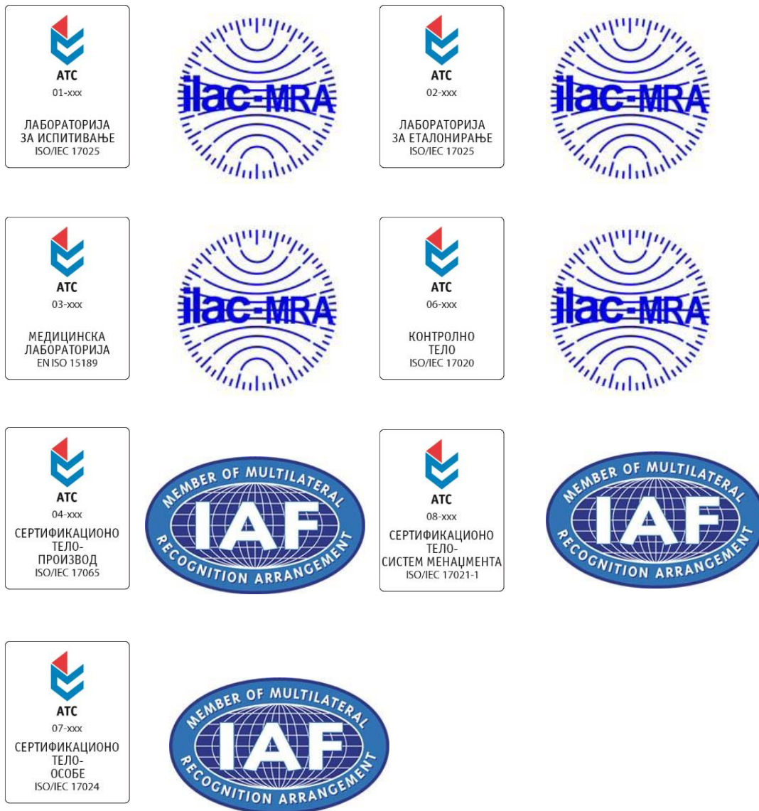
Слика 3: Комбиновани ИЛАС МРА и ИАФ МЛА знакови